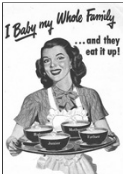
نقش زن در خانواده سنتی به شیوه های مختلف تبلیغ می شد

به چند عامل بستگی داشت: یکم، عکس العمل روحی و روانی جامعه به وقوع جنگ با لطمات انسانی سنگین اش. دوم، تاثیر دوران بازسازی و آرامش بعد از جنگ که تشویق و توجیهی است برای رشد تولید مثل در کنار سایر تولیدات جامعه. سوم، نقش کماکان سنتی زنان و ساختار