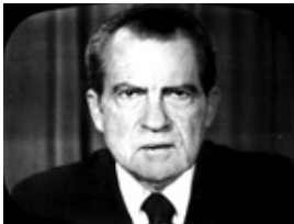
نیکسن اشک ریزان استعفاى خود را اعلام می کند.

ویتنامی باعث شکل گیری یک عقده روحی برای بورژوازی حاکم شد. پایان جنگ ویتنام به معنی حذف بستری بود که طی سال ها بسیاری از نیروها و افراد را در جنبش ضد جنگ گرد هم می آورد. بخش های لیبرال، رفرمیست های مذهبی و حتی عناصری از طبقه حاکمه که در