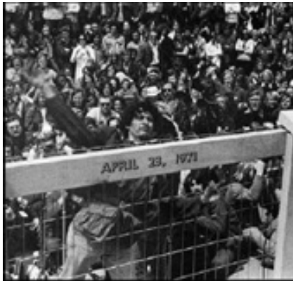
سربازان از جنگ برگشته مدال هایشان را نمی خواهند

سرشناس بریده شد. حتی یکی از وکلای مدافع مشهور که به اینگونه رای های ناعادلانه اعتراض کرده بود را به چهار سال حبس محکوم کردند که البته بعدا مجبور شدند آن را پس بگیرند. تبلیغ رسانه های رسمی و دستگاه انتظامی و قضایی این بود که فعالان جنبش حتما به مسکو یا هانوی وابسته اند. به دستور نیکسن، کمیته شش نفره هدایت