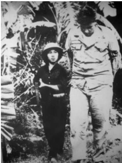
واقعیت شکست آمریکا در یک تصویر

محاکمه متهمان در دادگاه نظامی و پشت درهای بسته برگزار شد، اما ارتش در برابر فشار عمومی عقب نشینی کرد و برای هشت سرباز حکم های سبک برید. جنبش ضد جنگ اعلام پیروزی کرد. هشت سرباز در یک اقدام تهاجمی، متن شکایتی را علیه مقامات ارتش تنظیم کردند