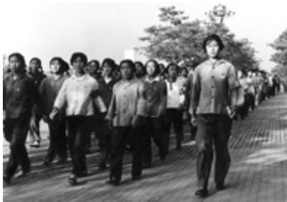
انقلاب فرهنگی در چین

سلسله مراتب موجود درون تشکل های مبارز سیاسی و اجتماعی، زن همچنان فرودست باقی مانده بود. شماری از این زنان که شعار «برابری برای سیاهان» را در خیابان فریاد می کردند، از خود پرسیدند که چرا