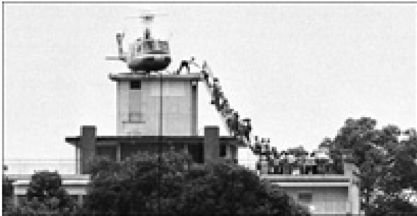
سایگون، ۱۹۷۵: فرار از بام سفارت آمریکا

ایالات متحده است که بدون شک تحت تاثیر کل جنبش انقلابی و ضدامپریالیستی دهه ۱۹۶۰ و مشخصا پیروزی توده های ویتنامی به وقوع پیوست. سال ۱۹۷۵، تصاویر مهیجی از ورود نیروهای آزادیبخش