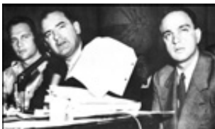
نفر وسط: سناتور مک کارتی در کمیسیون تفتیش عقاید سنای آمریکا

کمونیستی تولید می شد. حتی در فیلم های به ظاهر علمی تخیلی، دشمن اهالی زمین را مریخی های سرخ معرفی می کردند که آشکارا نماد کمونیست ها بودند. کشیشان در خطبه های روز یکشنبه به گوش مومنان می خواندند که: «نگذارید اینهمه مردم زیر سلطه